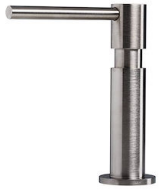
Dispenser Evo Satinée 8520 100