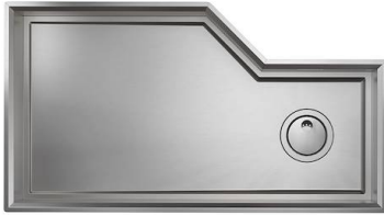
Évier Diade 3028 000