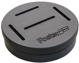
Porte-couteaux 8100 030