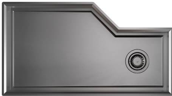
Évier Diade Gun Metal Fumè 3028 816