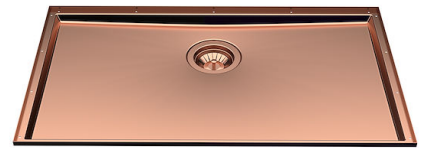
Évier Phantom Base Copper