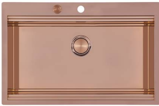
Évier Milanello Copper workstation