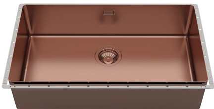
Évier Phantom Edge Copper