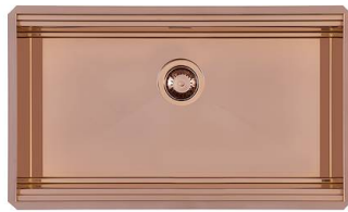
Évier Milanello Copper Workstation