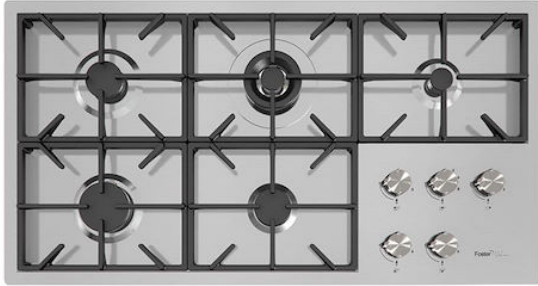
Table de cuisson Foster Milano