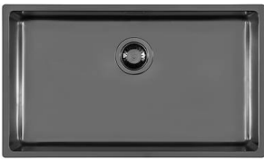
Évier KE Gun Metal 2157 856