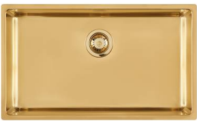
Évier KE Gold