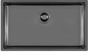
Évier KE Gun Metal