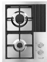
Table de cuisson S4000 Domino