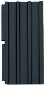
Support de pot en fonte