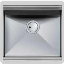
Évier Milanello Workstation