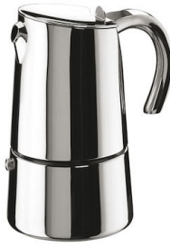
Moka Induction PRO