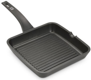
Grille de contact Induction PRO