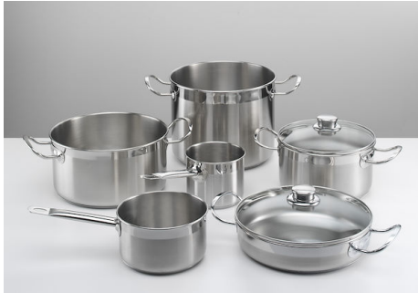
Série de pots induction PRO 8pcs.