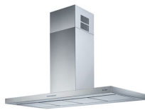
Hotte d'aspiration S4001 island 2442 _1