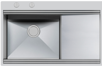
Évier Milanello workstation 1040 05x