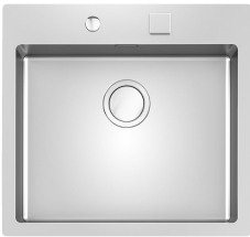
Évier S4001 Filotop - 3365 050