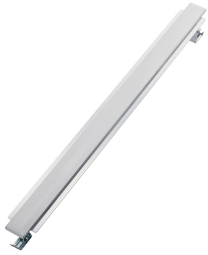
Séparateur des plans Domino 8320 000