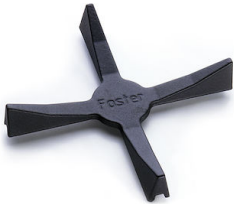
Support de Wok en fonte