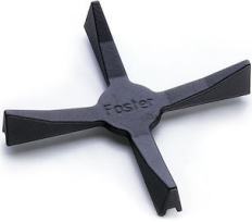
Support de Wok en fonte