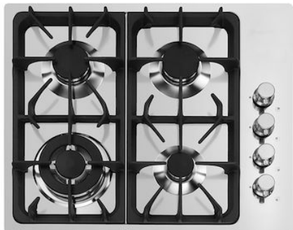
Table de cuisson Professionale