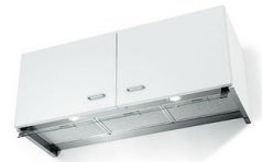
Hotte d'aspiration New Wing 2512 072