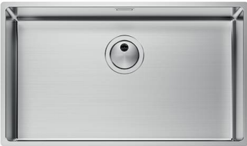
Évier S4001 3138 850