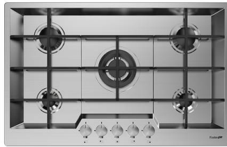
Table de cuisson KE 7602 032