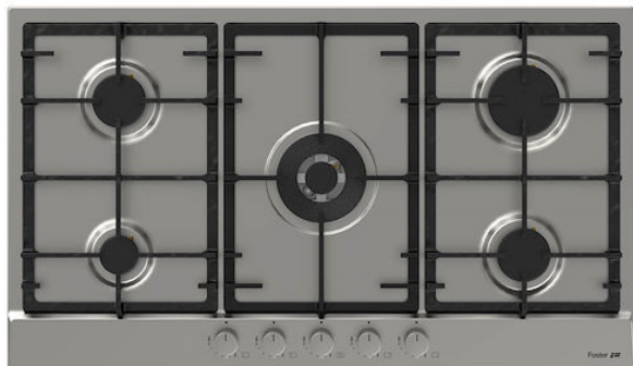
Table de cuisson Power