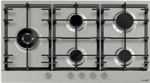
Table de cuisson Power