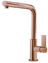
Mitigeur Omega Plus Copper 8498 858