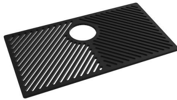
Grille Black 8100 653