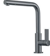
Mitigeur Omega Gun Metal