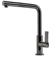
Mitigeur Omega Plus Gun Metal