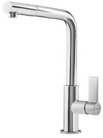
Mitigeur Omega Plus