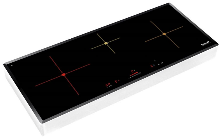
Table de cuisson Ognidove 5130 241