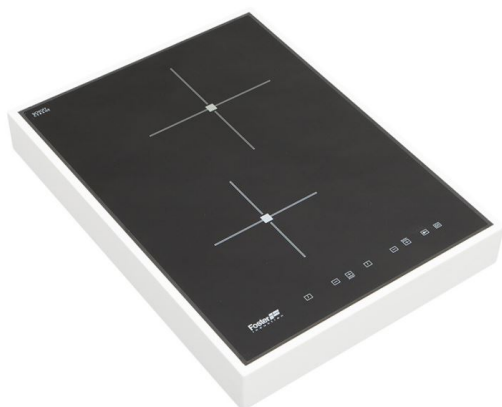
Table de cuisson Ognidove 5122 240