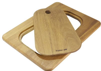
Planche de découpe Twin en bois Iroko 8644 041