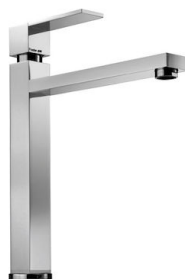
Mitigeur Tre Alto