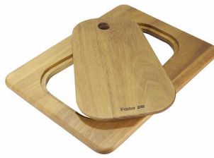
Planche de découpe Twin en bois Iroko