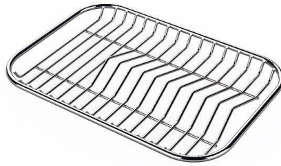
Grille porte-assiettes inox ne peut être utilisé qu'en combinaison avec les accessoires 8644 003 8100 154