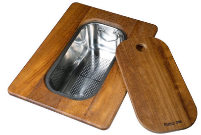
Planche de découpe Twin en bois Iroko avec tamis en acier inoxydable