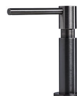
Dispenser Evo satiné Gun Metal 8520 156