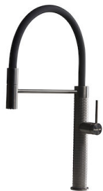
Mitigeur Skin Gun Metal 8424 856