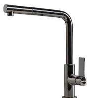
Mitigeur Omega Plus Gun Metal 8498 856