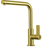
Mitigeur Omega Gold