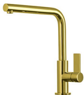
Mitigeur Omega Gold