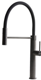
Mitigeur Skin Gun Metal