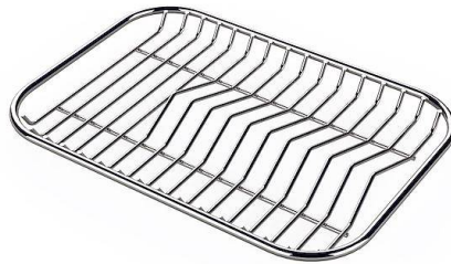
Grille porte-assiettes inox ne peut être utilisé qu'en combinaison avec les accessoires 8644 003 8100 154