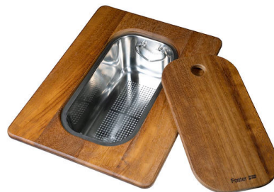
Planche de découpe Twin en bois Iroko avec tamis en acier inoxydable

* uniquement en combinaison avec l'accessoire 8644 101