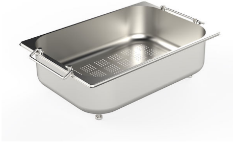
Passoire en acier inoxydable