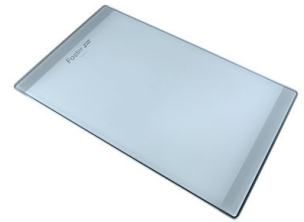
Planche de découpe en verre