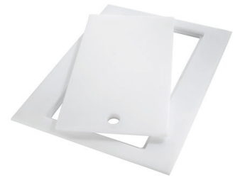
Planche de découpe Twin in HDPE