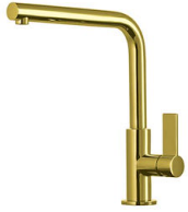
Mitigeur Omega Gold