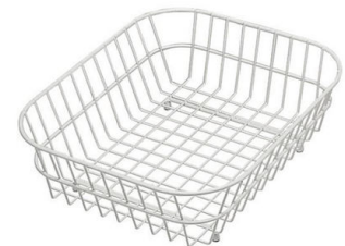
Panier en acier inoxydable