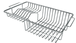
Panier à vaisselle inox