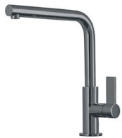
Mitigeur Omega Gun Metal