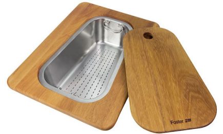
Kit planche de découpe en bois Iroko avec tamis en acier inoxydable