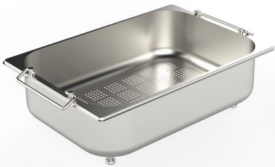
Passoire en acier inoxydable