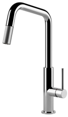
Mitigeur KS Plus 8522 000