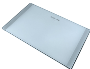
Planche de découpe en verre 8633 300