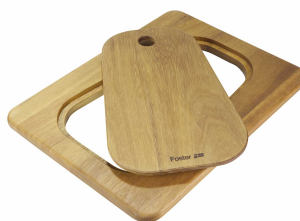
Planche de découpe Twin en bois Iroko 8644 041