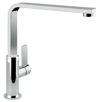
Mitigeur NYC 8486 000