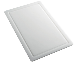
Planche de découpe en HPDE 8657 001