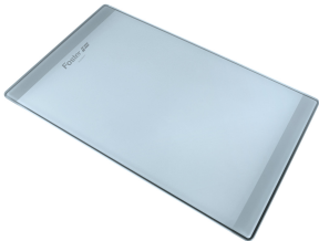
Planche de découpe en verre 8631 300