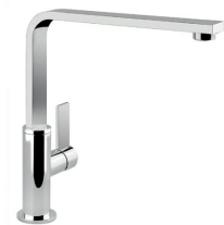
Mitigeur NYC 8486 000