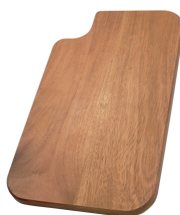
Planche de découpe en bois Iroko 8643 115