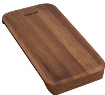
Planche de découpe coulissant Iroko 8643 116