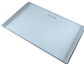
Planche de découpe en verre 8633 300