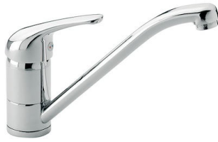
Mitigeur S1000 - RO