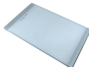
Planche de découpe en verre 8631 300