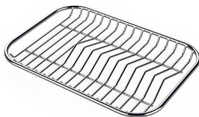
Grille porte-assiettes inox ne peut être utilisé qu'en combinaison avec les accessoires 8644 003 8100 154