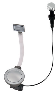
Vidange automatique Space 8407 109