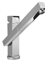
Mitigeur Twix Plus 8427 020