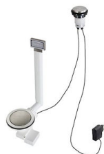
Vidange automatique Space Light 8407 117