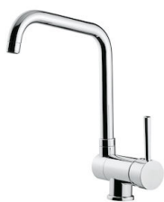
Mitigeur Drop 8523 000