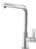
Mitigeur Omega 8497 000