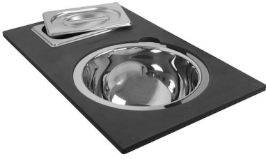
Kit multi-bol 8100 628