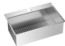
Passoire en acier inoxydable 8151 010