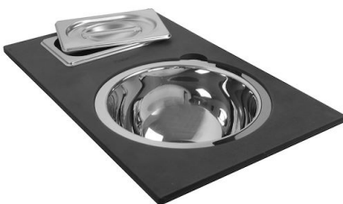
Kit multi-bol 8100 628