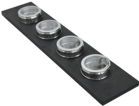
Ensemble de 4 porte-épices 8100 620