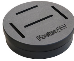
Porte-couteaux 8100 030 * uniquement en combinaison avec l'accessoire 8100 621