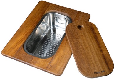
Planche de découpe Twin en bois Iroko avec tamis en acier inoxydable 8644 044