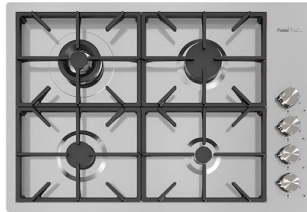
Table de cuisson Foster Milano 7637 000