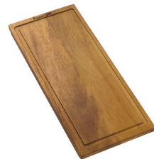
Planche de découpe en noyer 8642 000