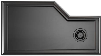
Fregadero Diade Gun Metal 3028 006