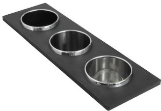
Conjunto de 3 porta-botellas