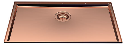
Fregadero Phantom Base Copper