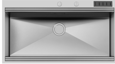
Fregadero Foster Milano 1017 055