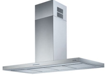
Campana extractora S4001 island 2442 __1